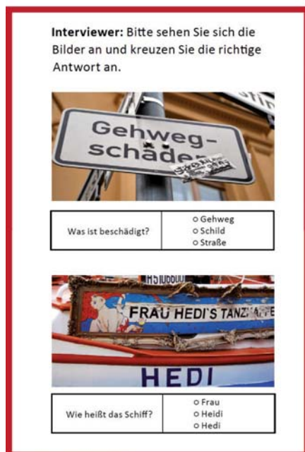
Abbildung 1 leo.-Studie: Beispielaufgaben für Alpha-Level 1 und 2 (Grottlüschen; Riekman 2011, S. 7)

Lange Zeit galt es als sicher: Analphabetismus ist kein Problem, das entwickelte Länder wie die Bundesrepublik betrifft. Mittlerweile wissen wir, dass es deutlich mehr Menschen gibt, die nicht ausreichend lesen, schreiben und rechnen können, als man lange Zeit geglaubt hat.