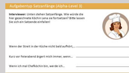
Abbildung 12 leo.-Studie: Beispielaufgaben für Alpha-Level 3 (Grottlüschen; Riekmann 2011, S. 7)

Lesen: Sinnentnahme von Schriftzeichen, meist visuell, ggf. aber auch wie bei der Braille-Schrift durch Berührung (taktil). Häufig wird phonisches L., bei dem die einzelnen Schriftsymbole (Buchstaben) gewissermaßen in Sprachlaute »übersetzt« werden, vom visuellen L. unterschieden, bei dem das Erscheinungsbild in größeren Einheiten wahrgenommen wird. Beim visuellen L. entziffert man also nicht Buchstabe für Buchstabe, sondern erfasst Wörter, Wortverbindungen oder Sätze als ganze Einheiten. Geübte und schnelle Leser lesen überwiegend visuell und greifen nur bei Unklarheiten auf das phonische Lesen zurück. (Siehe auch → Lesekompetenz )