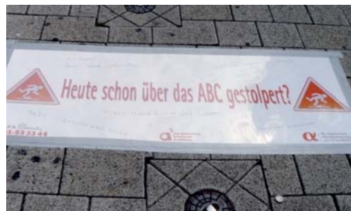
Foto Straßenaktion des ALBi-Projekts

Kontakte sind in der Öffentlichkeitsarbeit auch beim Thema Alphabetisierung und Grundbildung wichtig. Es zählt sich aus, Journalisten regelmäßig zu informieren und einmal entstandene Kontakte zu pflegen. Gut sortierte Verteiler, Präsenz und Ansprechbarkeit sowie ein Verständnis für die Regeln, nach denen Presse funktioniert, sind wichtige Zutaten zur Kontaktpflege.